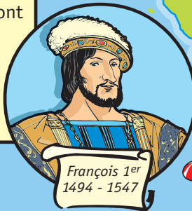
François 1 er 1494 - 1547

Après Clovis, roi des Francs de 481 à 511, des rois vont se succéder et diriger la France jusqu'en 1789, année de la Révolution française, qui supprimera la royauté.